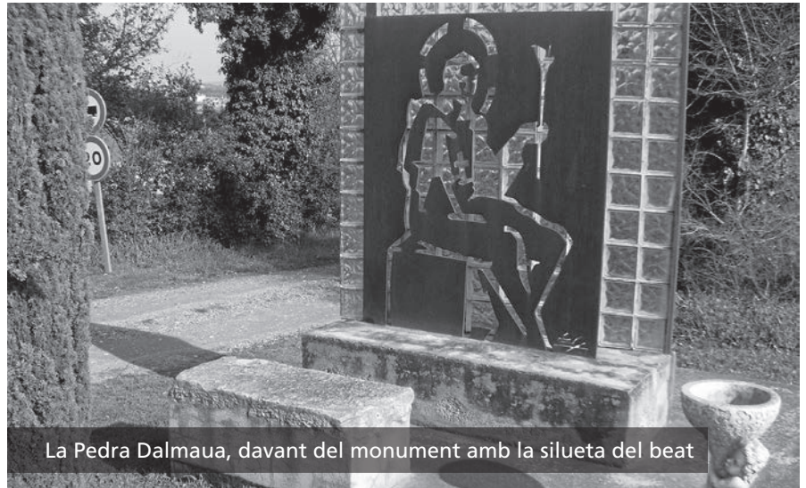
La Pedra Dalmaua, davant del monument amb la silueta del beat

Quan de jove estudiava al convent dels dominics de Girona, els dissabtes de bon matí sortia a peu en direcció a Santa Coloma de Farners per estar el cap de setmana amb la família. Quan passava per Aiguaviva s'asseia a reposar en una pedra. Els pagesos de la zona, quan van saber que aquell jovencell tenia fama de santedat, van voler conservar-la com una relíquia. Molts creien que tenia la propietat de protegir els camps. A finals del segle XIX sembla que es va ensorrar accidentalment. A principis del 2007, i amb l'ajuda de la tradició oral, l'Ajuntament la va recuperar excavant al lloc