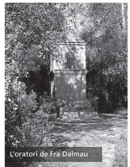
L'oratori de Fra Dalmau